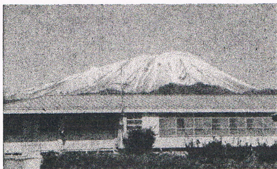
盛岡少年鑑別所と岩手山